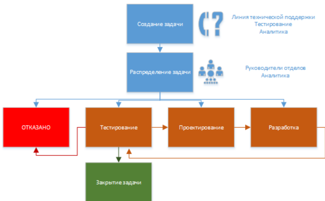
Рисунок 2 - Жизненный цикл задачи в системе отслеживания ошибок